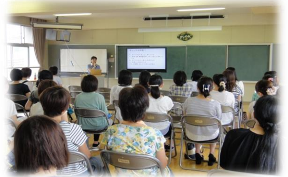
(小学生の保護者対象の講座風景)

奈良・大阪の学校園や子育て支援センター等ではもちろん、グランフロント大阪、公文奈良京都事務局、シャープ株式会社様等でも開催。毎回満員御礼の人気講座です。